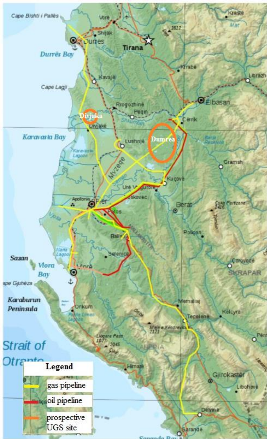
Figure 2—2_ Paraqitje skematike e pozicionit të tubacioneve egzistuese të gazit e naftës si dhe vendeve të mundshme nëntokësore të gazit